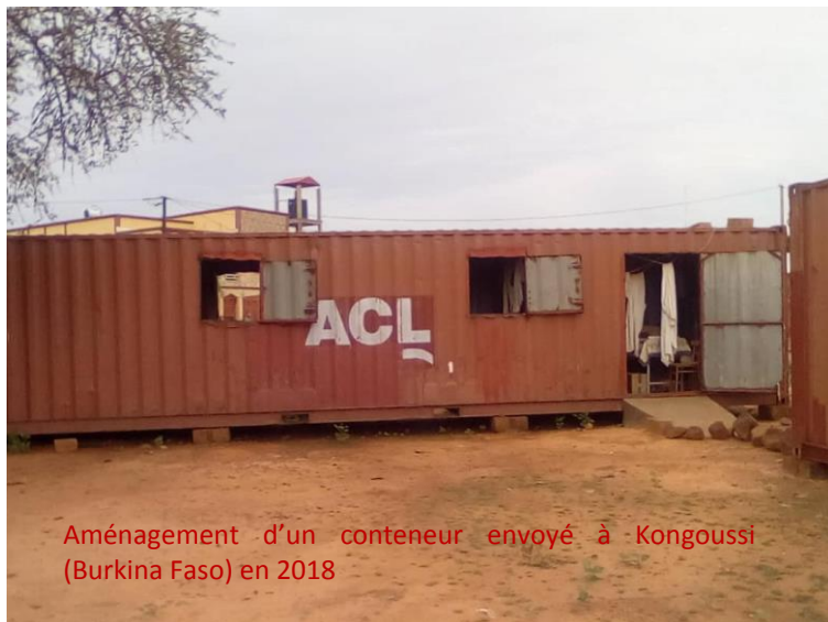
Aménagement d'un conteneur envoyé à Kongoussi (Burkina Faso) en 2018