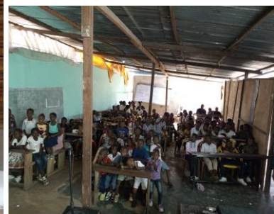
Mini-imprimerie (à gauche) Classe surpeuplée (au-dessus)