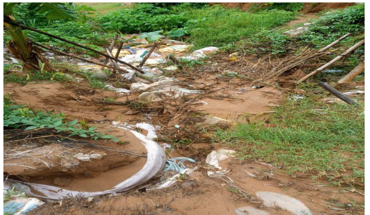
Autre scène des inondation et nouveau stock de médicaments