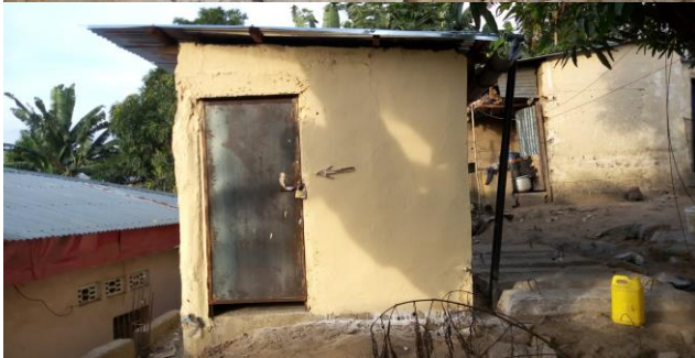
La première photo montre les dégâts causés au bloc sanitaire et les deux autres, son état avant les inondations